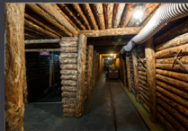
14. Interior Museo Minero de Utrillas.