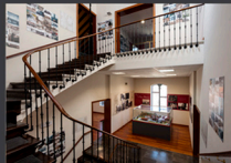
14. Interior Museo Minero de Utrillas.