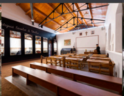
1. Antiguas escuelas.