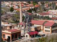
Parque Temático de la Minería.