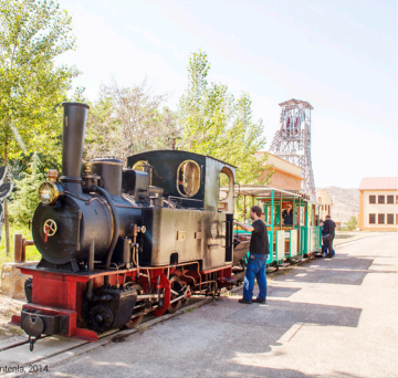
Fot. A. Fontenla, 2014.

Gracias al empeño del Ayuntamiento de Utrillas y la gran labor desinteresada de la Asociación de Voluntarios del Patrimonio de Utrillas y de la Asociación Aragonesa de Amigos del Ferrocarril y Tranvías podemos visitar este Parque Temático de la Minería .