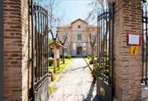
14. Museo Minero de Utrillas.

RECORRIDO LOCOMOTORA A VAPOR "HULLA" (1903)