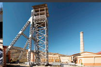
3. Castillete del Pozo de Sta. Bárbara.