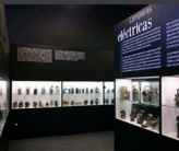
1. Museo de los Utilsios Mineros.