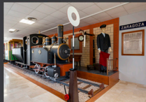
14. Interior Museo Minero de Utrillas.